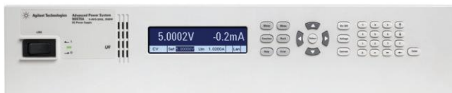
Источник питания N6970A (размер 2U)