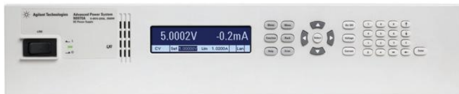
Источник питания N7970A (размер 2U)